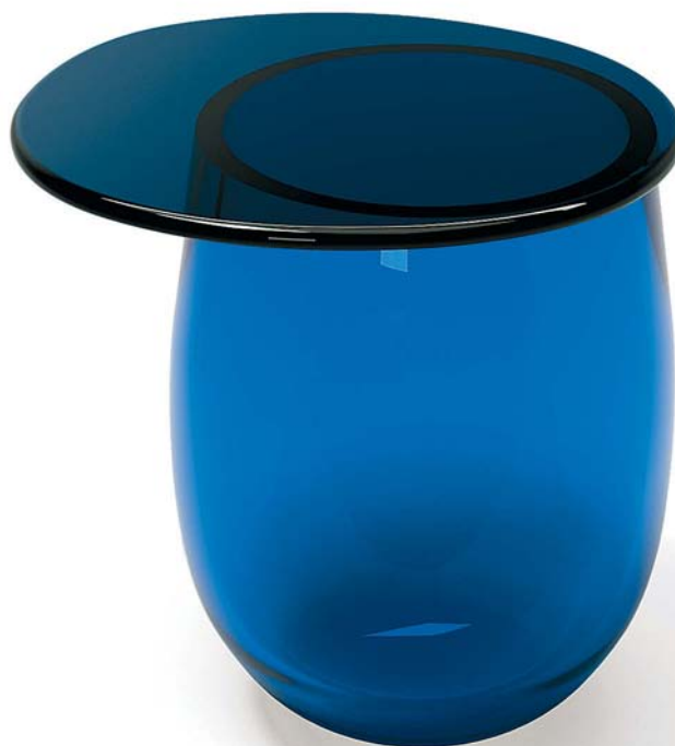
▲ Стекланный стол Blow для Established & Sons

Но аэропорт, оказывается, никому и не нужен. Константина любят за научный подход и технологическую поисковую работу, которая по итогу заметна лишь на изнанке изделия. Так, стол 8-Pack — это прямоугольная столешница и восемь ног — банально, просто и очевидно. Опять обман — Грчич смело делает то, за что другого назвали бы еретиком. Но Константин сочинил оду утонченности: в столах нет ни шурупа, ни сварочного шва. 8-Pack полностью вырезан лазером и в индивидуальном порядке покрыт аэрозольной краской. Ножки и сто-