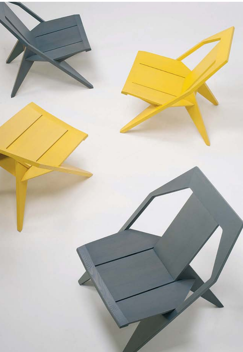
Деревянные стулья Medici для Mattiazzi ▼