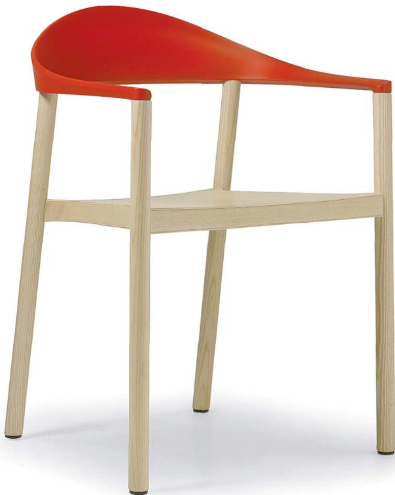
▲ Стул с пластиковой спинкой Monza для Plank