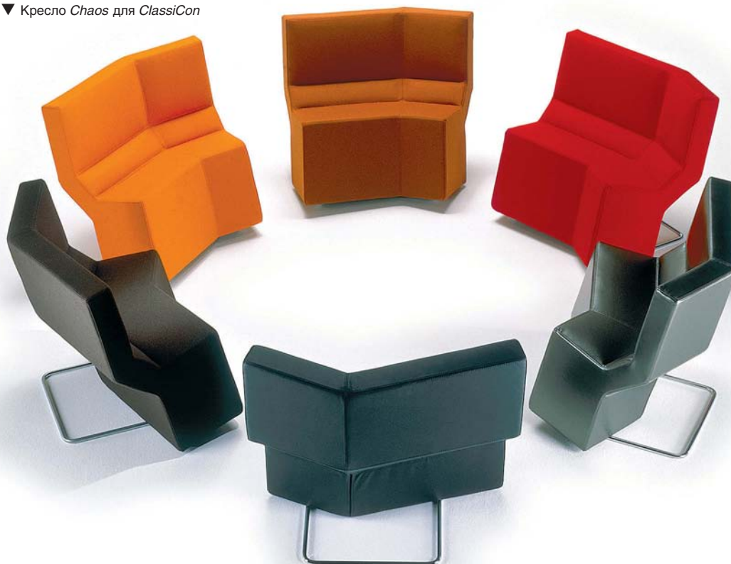
▼ Кресло Chaos для ClassiCon

Грчича и его рациональные изделия, лишенные мишуры, теперь тоже относят к этому течению. Впрочем, по сути, не так важно, как называется твой стиль, если твои работы находятся в основных фондах MoMA и центра Помпиду. Грчич вовсе не планировал становиться самым известным немецким дизайнером. В 1990 году, когда Грчич делил ветхую мастерскую с одним из однокурсников в Лондоне, он полетел в Германию проведать родителей на Рождество. По возвращении произошла неразбериха с документами, и Константину пришлось вернуться в Мюнхен. За то время, пока он переформлял документы, он открыл свою дизайнерскую студию. В Англии он был бы одним из многих, а в Германии стал номером один. Эта страна, целое поколение которой ничего не хотело иметь с прошлым, восстановила себя ценой утери многих культурных традиций. Грчич же не только всегда был объективен и современен, но и чтит историю. Поэтому и работы его переполнены не собственным эго, а интеллектуальным посылом. Виртуально оценить их, однако, непросто. Трудлюбивый немец работал не только над технологически заряженными шедеврами вроде Chair_One , но и над такими обыденными вещами, как вешалки или ручки