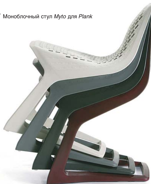
▼ Моноблочный стул Myto для Plank

Сегодня Грчичу естественным образом удастся совмещать ремесло, технологии и менеджерские таланты. В то время как дизайнеры наполняют ма-