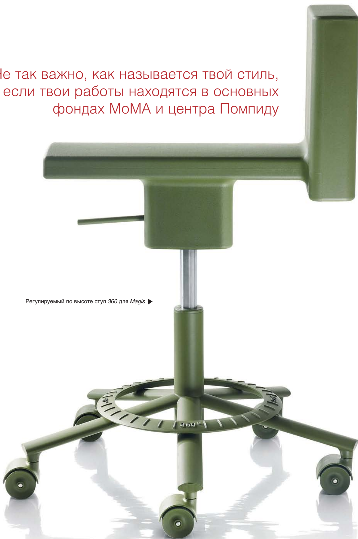
Регулируемый по высоте стул 360 для Magis ▶

Не так важно, как называется твой стиль, если твои работы находятся в основных фондах МоМА и центра Помпиду