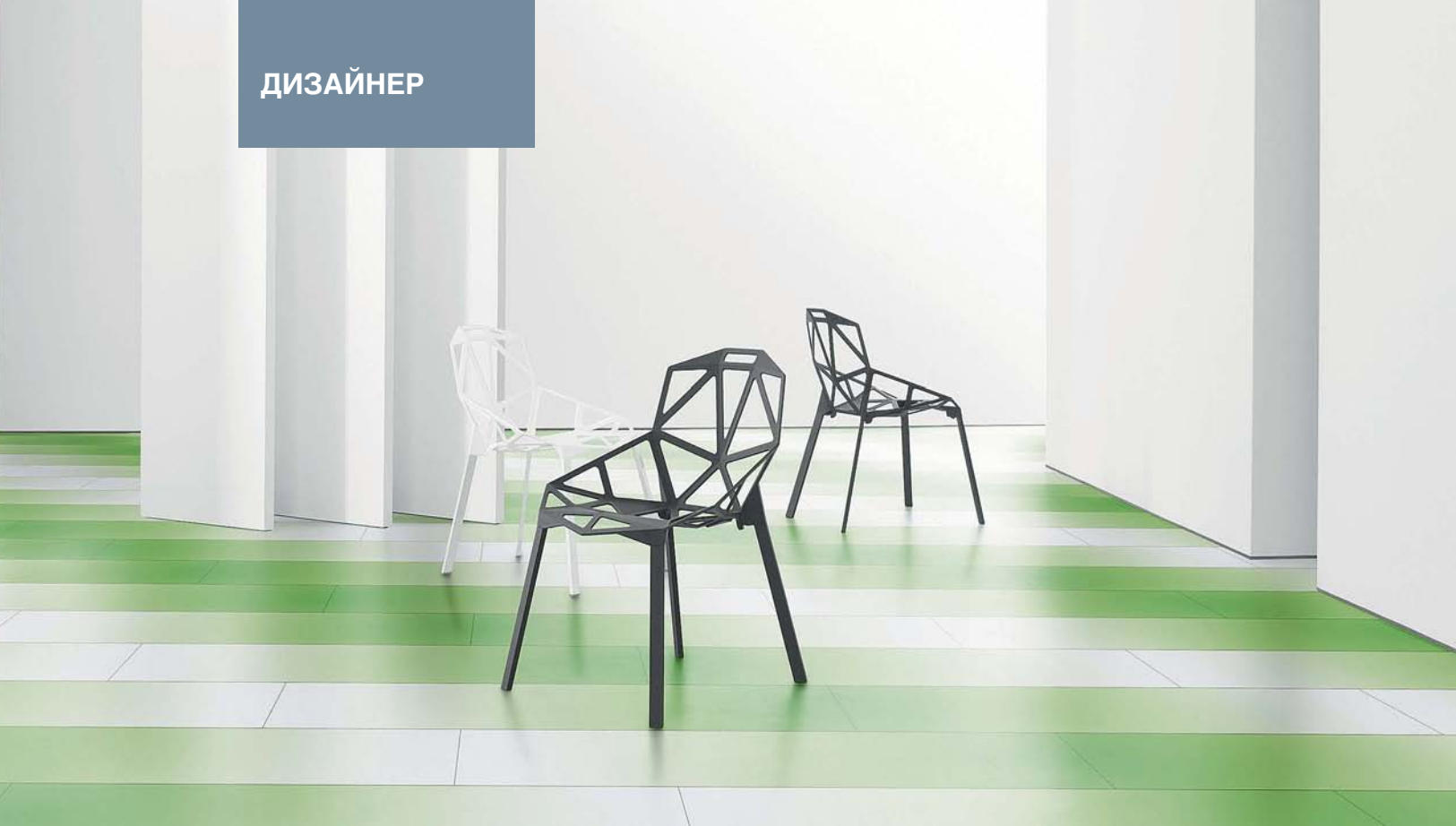
▲ Ламинат Parador , коллекция Edition 1 , декор Sunray