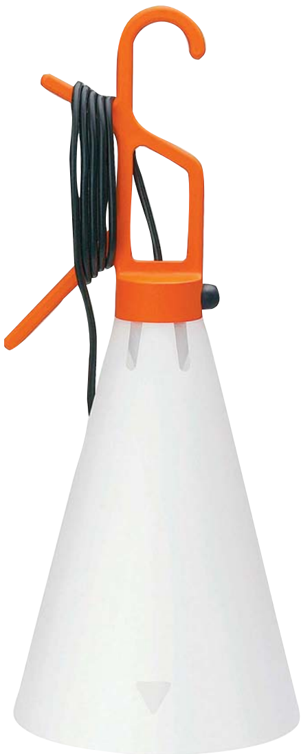
▲ Портативный светильник Mayday для Flos

для письма. Ламинат для Parador , зонты для Muji , столовые приборы для Serafino Zani — Грчич совершает микрореволюцию в каждой области промышленного дизайна. За свою более чем 20-летнюю карьеру он воссоздал множество разноплановых предметов. Для него дизайн — серьезный бизнес, но это не значит, что он предпочтет серию клубных кресел мусорной корзине. Хотя коллекцию стульев, возможно, и предпочтет.