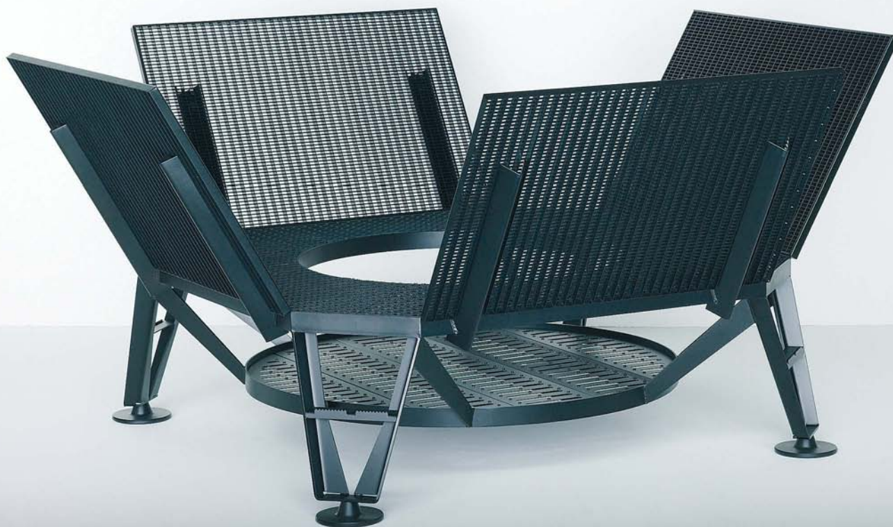
▲ Металлическая скамейка Landen для Vitra

мисс. Ясное дело, что уступать будет не Грчич. Тому есть предпосылки. Качество — первое условие его работы. Честность — второе. Скрупулезность, ответственность и скромность — уже производные от первых двух. Константин все еще ходит с толстым скетчбуком и собирает модели будущих стульев из бумаги, дерева и проволоки. Его рука касается всего, на чем написано KGID .